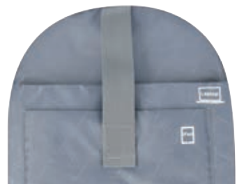
Laptop and tablet pocket

ST.REET IS A BRAND FOR YOUNG AND ACTIVE PEOPLE. PRODUCTS FOR KIDS, YOUTH AND PARENTS. PERFECT FOR SCHOOL AND TRAVELS.