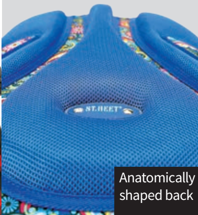
Anatomically shaped back