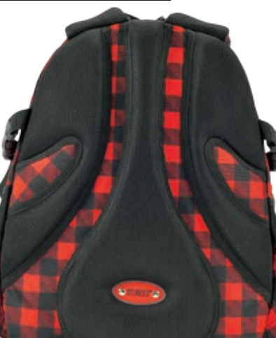
Anatomicznie profilowane plecy