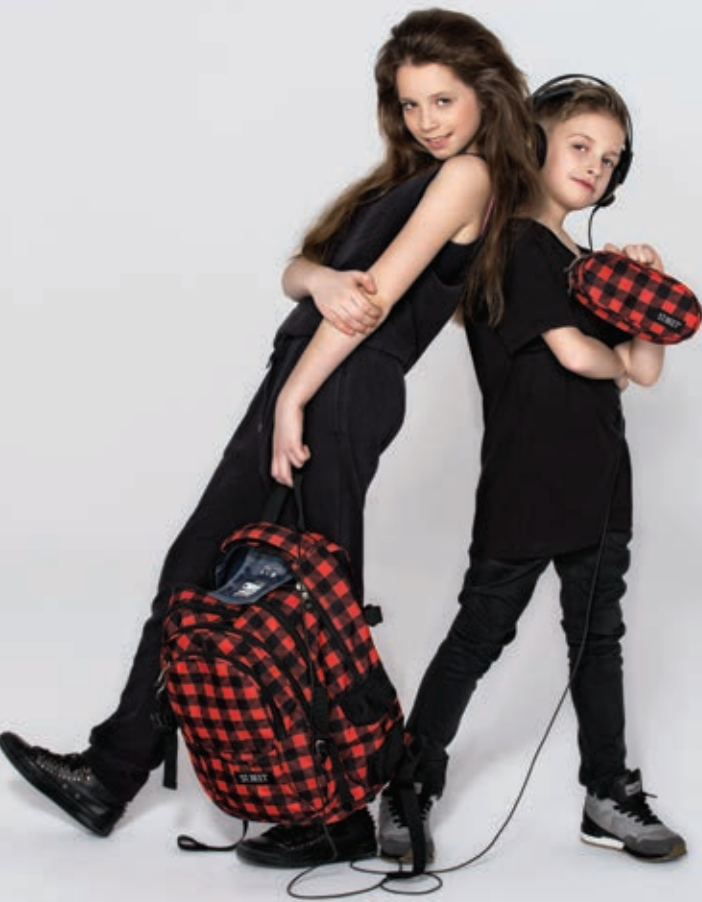
Wnętrze plecaka z organizmem