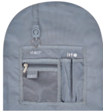
Well organised inside