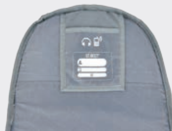
Phone pocket with headphones output